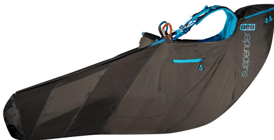
03-17-0460 17-0657 neo koroyd 1.0 intégrée dans la sellette NEO Suspenders